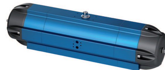
SAF - 180°