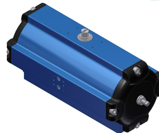
SAD - 180°