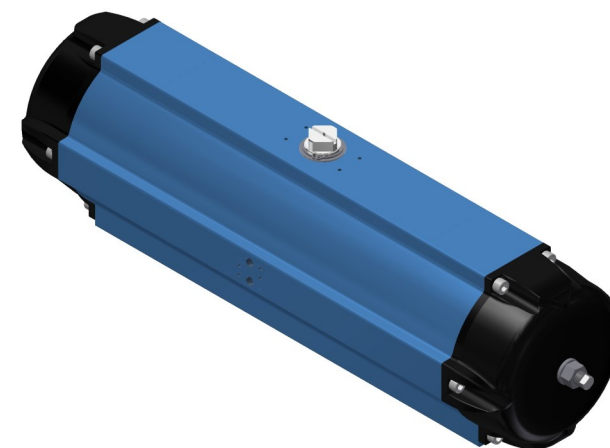
SAF - 180°